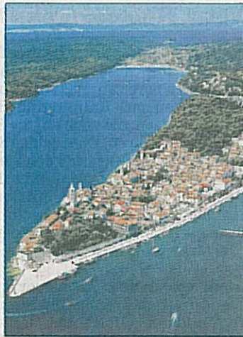
Die kroatische Insel Rab aus der Vogelperspektive.

■ Informationen: Tourismusregion Kvarner bei der Kroatischen Zentrale für Tourismus, Kaiserstraße 23, 60311 Frankfurt, ☎ 069/2385350, Infos im Internet unter www.kroatien.hr , www.tzg-rab.hr